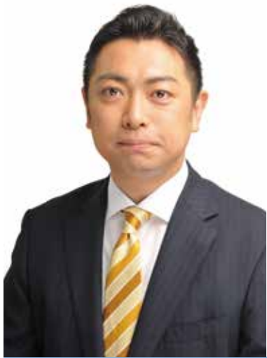
東京都議会議員 ほっち易隆