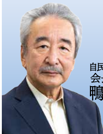
自民党足立総支部連合会 会長 鴨下一郎

私も応援します。長い間、消防団・地域のためのボランティア活動をされてきた経験を活かし、足立区都民の皆さまのためにしっかりと働いてくれることと思います。